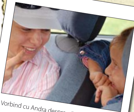
Vorbind cu Andra despre păcat

— Crezi că a murit și pentru păcatele tale? Vrei ca viața ta să fie schimbată? Vrei să ți ceri iertare chiar acum? Și spre surprinderea mea, la toate aceste întrebări, ea a răspuns „ da ”. Așa că am continuat: