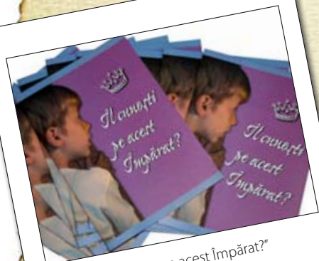
Broșura „ Îl cunoști pe acest Împărat? ”

Am pregătit textul și layout-ul în limba română cu câțiva ani în urmă, când misiunea noastră a organizat o distribuție a acestei cărți în fiecare casă din București. Ca pentru orice material la care lucrez, m-am rugat ca Dumnezeu să o folosească spre slava Sa, dar nu m-am așteptat să văd cu ochii mei cum. Cu ocazia sărbătorii Paștelor, fiecare casă din orașul București a primit o astfel de carte în cutia poștală, dar eu nu eram acolo. Acum însă, stăteam de vorbă cu o fetiță de 5 ani, ținând în mână această carte. I-aș fi putut-o dărui, să o ia acasă și să o roage pe mama sau un frate să i-o citească, dar am ales altceva. Am ales să o citesc cu voce tare pentru ea și să-i pun întrebări ca să mă asigur că înțelege ce citesc.